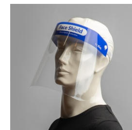
Pantalla Face Shield