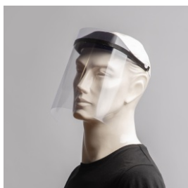
Pantalla Galink flexible